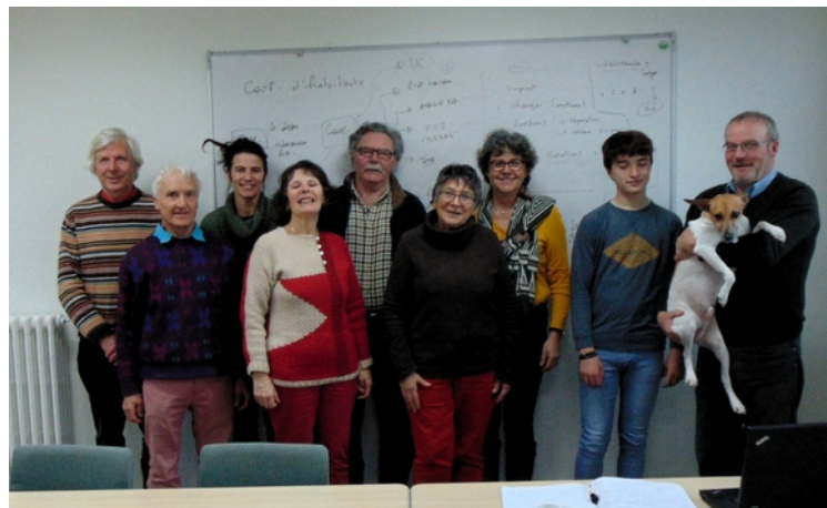
Le groupe, il reste quelques places